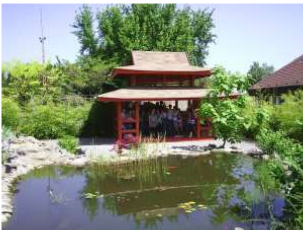
A továbbtanulás erősítése a Móríc Zsigmond Iskolában

Ezután nyíregyházi kalandpark területén próbálhattuk ki fizikai állóképességünket és ügyességünket. Jó kedvűen telt el ez a nap is, rengeteget nevtünk, sokat beszélgettünk.