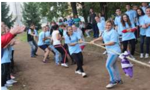
A továbbtanulás erősítése a Móricz Zsigmond Iskolában

Az Ibrányért Összművészeti Egyesület szervezésében mentoráltjaimmal egy kellemes sporthétet vehettünk részt 2014. augusztus 29-től szeptember 02-ig. Különböző sportágakban mérhették össze erejüket: labdarúgás, kézilabda, kosárlabda, atlétika, ügyességi játékok. A legkedveltebb programok a váltó versenyek és a zumba parti volt. Nagyon jól éreztük magunkat ezen a héten is.