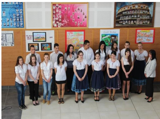
Ibrányi Móricz Zsigmond Gimnázium, Szakközépiskola és Kollégium TÁMOP-3.3.10.-B-12-2013-0016.

Családi nap: Iskolánk úgy döntött, hogy május 08-án szervez egy családi napot, melyen a kollégákon, a diákokon és a mentorokon kívül a tanulók szüleit is meghívtuk. A nap a diákok kulturális műsorával indult, ahol verssel, tánccal, énekkel és egy drámai előadással szórakoztattak bennünket tanulóink. A szórakoztató előadás után családiasabb hangulatban folytatódott a délután. Egy közös főzésre került sor, mely közben könnyedebb hangulatban beszélgethettünk a mentoráltjaink szüleivel is. A szervezésben és lebonyolításban aktívan részt vettem.